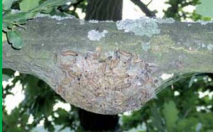
Gefährlich für den Menschen: Raupennest im Sommer vor der Verpuppung