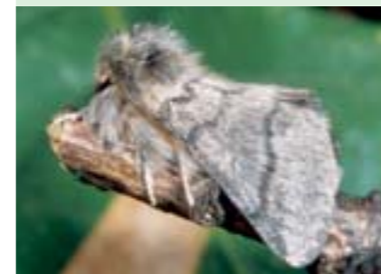
Der für den Menschen ungefährliche Schmetterling fliegt im August.