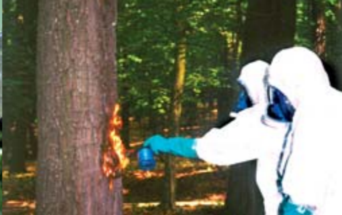
Mitunter ist großer Aufwand notwendig, um den Eichenprozessionsspinner erfolgreich zu bekämpfen.