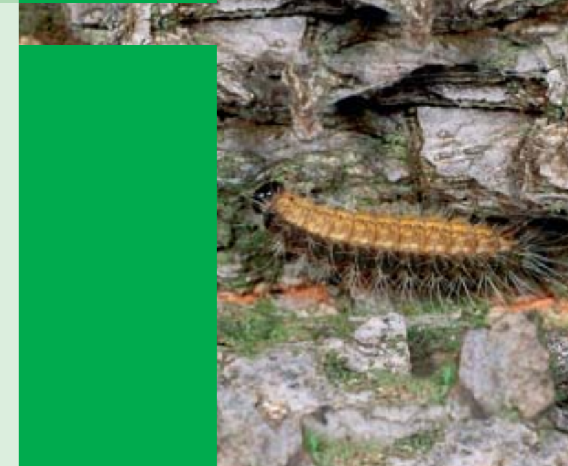
► Raupe mit Gifthaaren